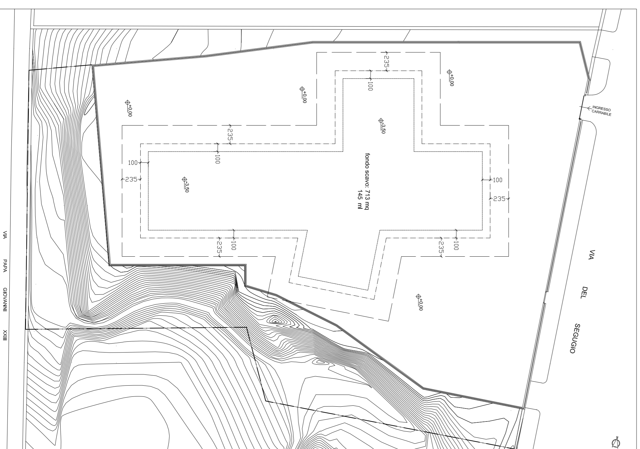
PLANIMETRIA GENERALE CON INDIVIDUAZIONE AREA DI SCAVO

Per il Raggruppamento Ing. Ivan Torretta Ordine degli Ingegneri della Provincia di Palermo n. 5091