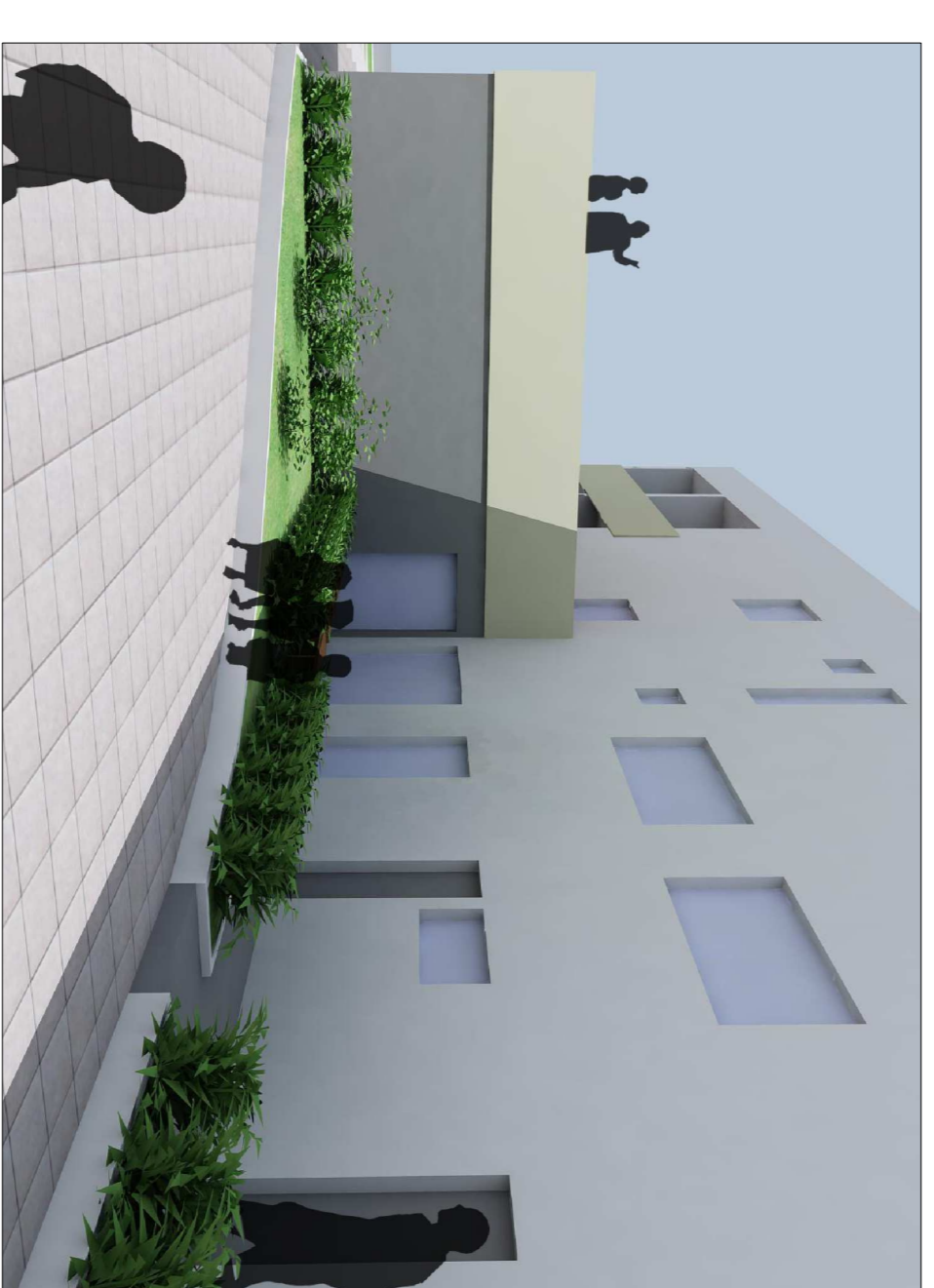
VISTA DEL PROSPETTO NORD